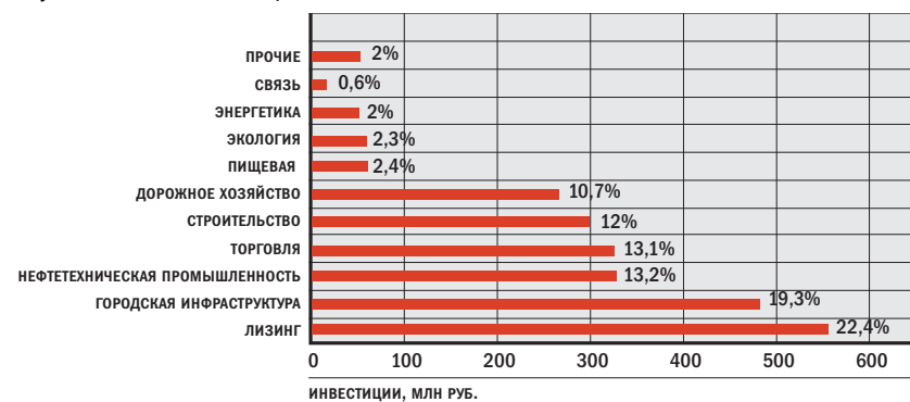
Рисунок 1. СТРУКТУРА ИНВЕСТИЦИЙ ПО ОТРАСЛЯМ

В 2004 г. городской бюджет был исполнен на уровне в 6,1 млрд руб. при запланированном объеме в 4,3 млрд руб. Фактический бюджет города вырос с 2000 по 2004 г. в 1,6 раза.